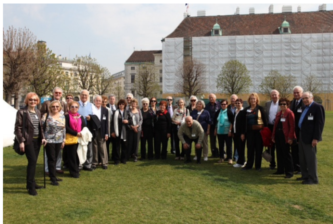
Die vom Jewish Welcome Service im April eingeladene Gruppe vertriebener jüdischer Bürgerinnen und Bürger besucht das Projekt " Sowing the Seeds " auf dem Wiener Heldenplatz

In unmittelbarer Nähe der Ausstellung im Ringturm : Palais Hansen, umgebaut nach den Plänen von Boris Podrecca, eröffnet als Palais Hansen Kempinski.