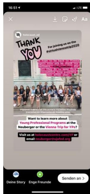
Aus der Virtual Vienna Tour des Holocaust Education Centres Toronto auf Instagram