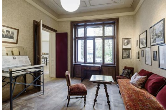
Das Freud Museum: einer der Tipps des JWS für den virtuellen Wien-Besuch

Viele von ihnen haben sich bereits monatelang auf einen emotional an sich nicht leichten Wien-Besuch vorbereitet. Dieser muss leider wegen der Corona-Pandemie abgesagt werden. „Wir bemühen uns“, heißt es in dem Schreiben, „weiterhin Angebote wie zum Beispiel die Unterstützung bei Familienforschung und die zahlreichen Projekte und Kooperationen auf die eine oder andere Weise auch in Zeiten von Corona durchzuführen um der Vermittlungsfunktion zwischen Österreich und den vertriebenen Bürgerinnen und Bürgern sowie deren Nachkommen gerecht zu werden.“